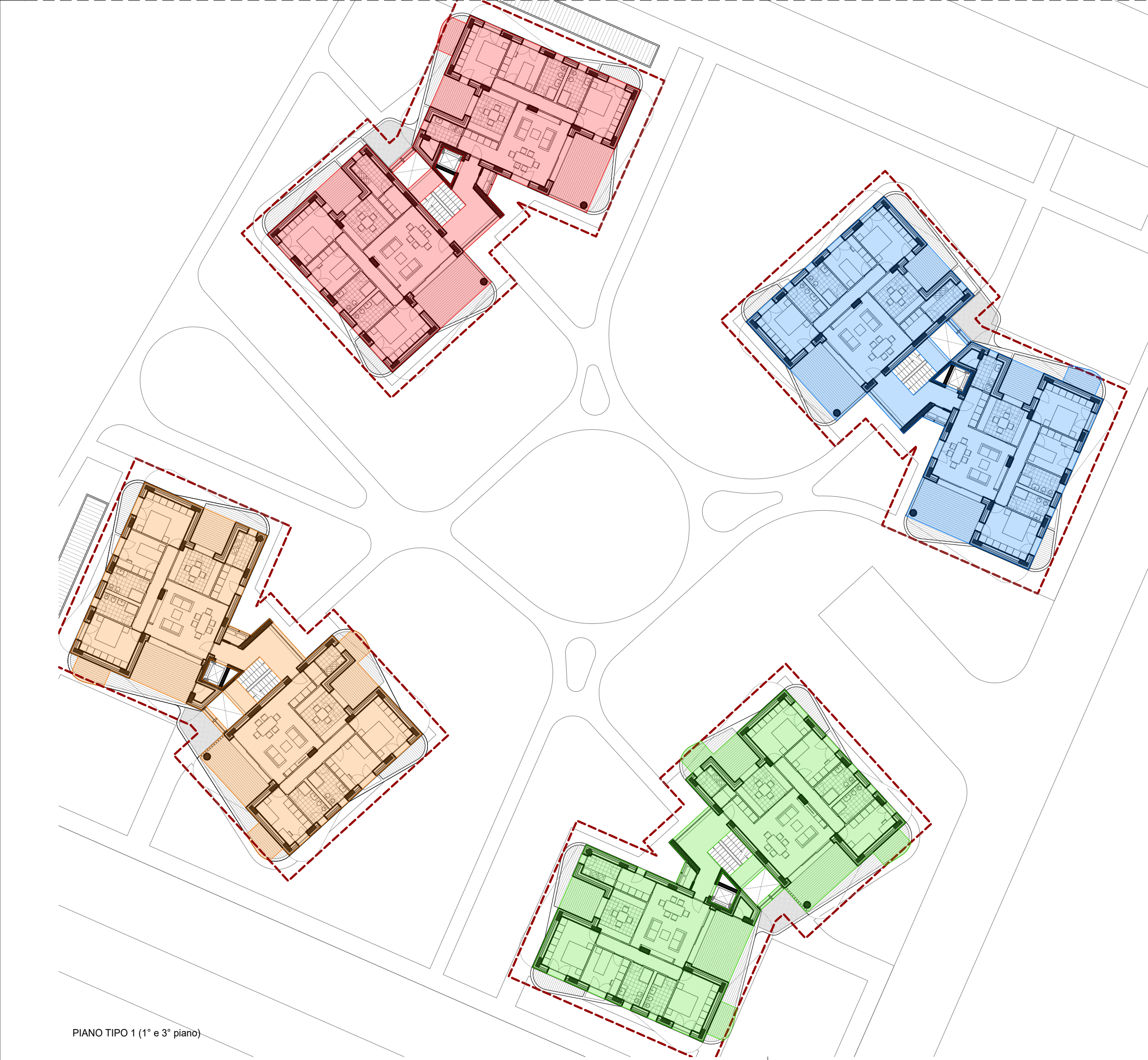
PIANO TIPO 1 (1° e 3° piano)